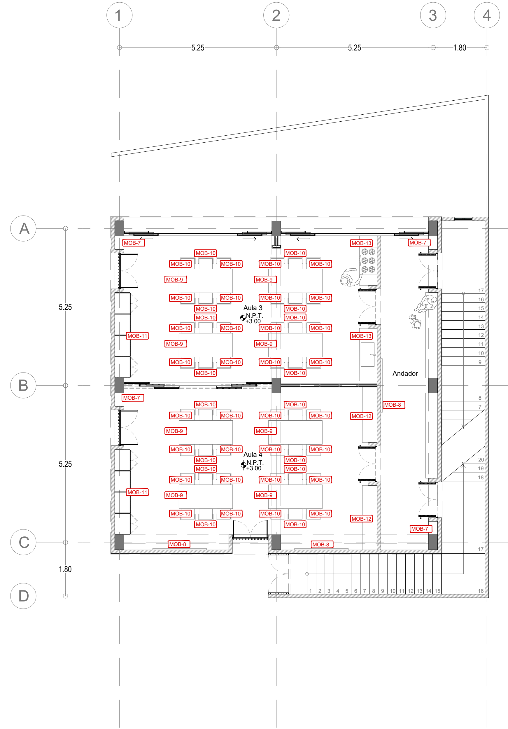
Centro Comunitario Primer Nivel escala 1:75